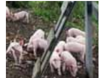
erster Freigang ▲