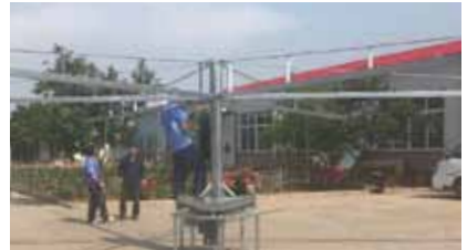
erst mal ausprobieren - läuft!

2014 setzten wir mit dem Besuch der China Horse Fair in Peking einen Fuß auf bis dahin für uns neues Terrain. Wir wussten nicht wirklich, was uns erwartet. Wir haben den Markt erkundet und erste Kontakte geknüpft. War es das sogenannte Bauchgefühl? Jetzt im Juni ist die erste Führenanlage im Reich der Mitte angekommen und ein Laufband wurde jetzt die Tage verschifft. Ein erstes Erfolgserlebnis. Die Entscheidung für den Besuch der nächsten CHF im Oktober ist klar.