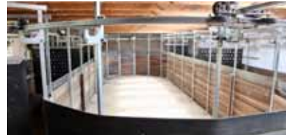
Gleitschienen-Führanlage in Salgen