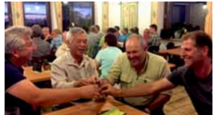
Hohenlohe von seiner schönsten Seite.