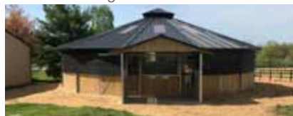
Kessler Show Stable