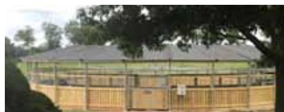
fünfte Führenanlage für Ashford Stud ▲