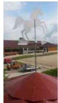
Pferde geben die Richtung an.

Der RFV Stuttgart ruft plötzlich an und erzählt, dass ihre Decken-Führanlage einsturzgefährdet ist. Ein Wasser-Rohrbruch brachte die Bodenverhältnisse ins Wanken. 70 Pferde im Stall und mitten im Kräherwald in Stuttgart - für diese Notlage benötigten sie dringend eine Alternative. Kurzerhand konnten wir vorübergehend eine Boden-Führanlage mit Hufschlagdach liefern und erhoffen für den Betrieb baldige Entwarnung.