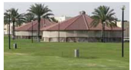
Al Khor - mitten im Wüstenstaat Katar

Saudi-Arabien und die restliche Arabische Welt verhängen ein Embargo gegen Katar. Kurz nach Trumps erstem Staatsbesuch in Riad. Wir sind erschrocken, als wir das hörten und gleichzeitig froh, denn wir haben noch im Frühjahr unser Großprojekt mit einem Umfang von vier Longierhallen mit Decken-Führanlagen abgeschlossen. Das sind zusammen 14 Decken-Führanlagen in Katar. Die nächsten Anfragen laufen. Noch besteht keine Panik. Ein Einfuhrstopp besteht von Europäischer Seite noch nicht und wir hoffen, die Isolation wird bald wieder aufgehoben.