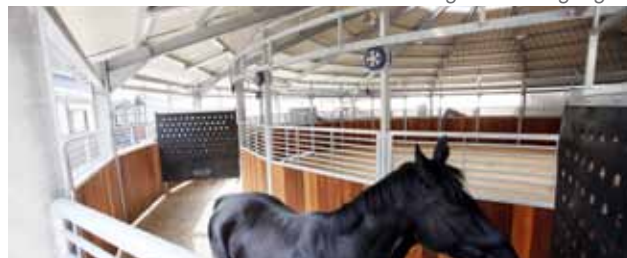
doppelt geführter Ring mit Rollen ▼