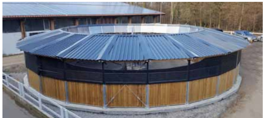
Boden-Führanlage mit Windnetz und Windfang innen

Der RFV Stuttgart ruft plötzlich an und erzählt, dass ihre Decken-Führanlage einsturzgefährdet ist. Ein Wasser-Rohrbruch brachte die Bodenverhältnisse ins Wanken. 70 Pferde im Stall und mitten im Kräherwald in Stuttgart - für diese Notlage benötigten sie dringend eine Alternative. Kurzerhand konnten wir vorübergehend eine Boden-Führanlage mit Hufschlagdach liefern und erhoffen für den Betrieb baldige Entwarnung.